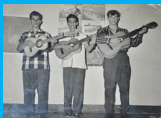
Participacion di Trio Los Madrigales